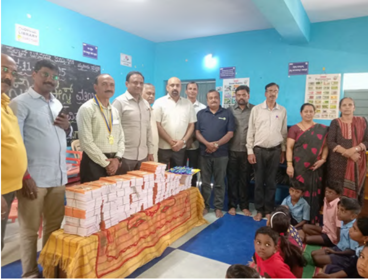
Distribution of note books to the students of Pahilwan Basavaiaha govt higher primary school, Jayanagara